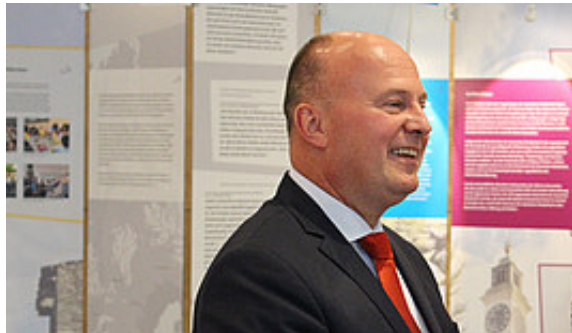
Hartmut Koschyk, Beauftragter der Bundesregierung für Minderheiten

Gaida: Dass die Ausstellung nicht von einem einzelnen Land, sondern von 25 Gruppen auf einmal erzählt, hat eine besondere Relevanz. Eine so umfassende Ausstellung gab es meines Wissens nach in dieser Form noch nie! Auf "Ländertafeln" werden die einzelnen Minderheiten der Länder mit herausragenden Projekten vorgestellt. Darüber hinaus werden Schicksale und Identifikationselemente der Gruppen aufgezeigt, zum Beispiel die Deportationen, Ausgrenzungen und die Zwangsarbeit in der Nachkriegszeit. Gleichzeitig regen Themen wie Jugendarbeit, Medien und Religion dazu an, über Minderheiten in ihrer Vielfalt zu sprechen.