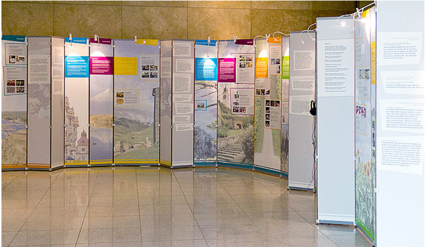
Die Ausstellung "In Zwei Welten" präsentiert 25 Geschichten deutscher Minderheiten.

Zusammenarbeit mit den Mittlerorganisationen, die sich mit deutschen Minderheiten beschäftigen, zum Beispiel das ifa und das Goethe-Institut. Eine stärkere Vernetzung innerhalb der "Föderalistischen Union Europäischer Nationalitäten", des Dachverbandes der autochthonen Minderheiten in Europa, ermöglicht uns, über eine gemeinsame Arbeitsweisen und Methoden nachzudenken. 2018 möchten wir in "Zukunftswerkstätten" Strategien für eine langfristige Verbesserung unserer Situation erarbeiten. Eins ist klar: Innerhalb unserer Arbeitsgemeinschaft ist es möglich, eine bessere Kooperation für Selbsthilfe zu schaffen. Nach dem Motto: die Größeren helfen den Kleineren.