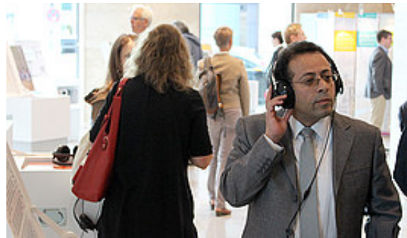
Die Audiostationen kamen bei den Ausstellungsbesucherinnen und -besuchern in Berlin gut an

ifa: "Von deutschen Minderheiten über deutsche Minderheiten" – Die Ausstellung soll den Besucherinnen und Besuchern die Vielfalt der deutschen Minderheitengruppen ins Bewusstsein rufen und zum Nachdenken und Diskutieren anregen. Wie wurde das umgesetzt?